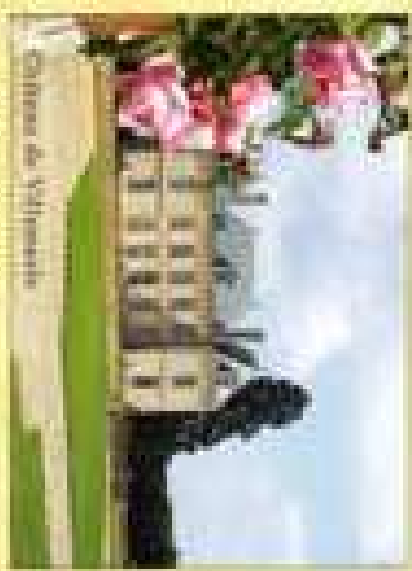
Maison de la Commune